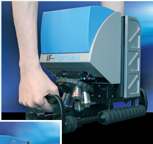
Bild 2. Der IF-Portable als bewegliche Messstation für den mobilen Gebrauch. Mit dem System lassen sich sowohl gekrümmte als auch glatte, ebene Oberflächen messen.

Der IF-Portable ist im Gegensatz zur fixen Positionierung innerhalb einer Fertigungslinie ein optisches Messsystem für den mobilen Gebrauch (Bild 2): eine Messstation, die dort