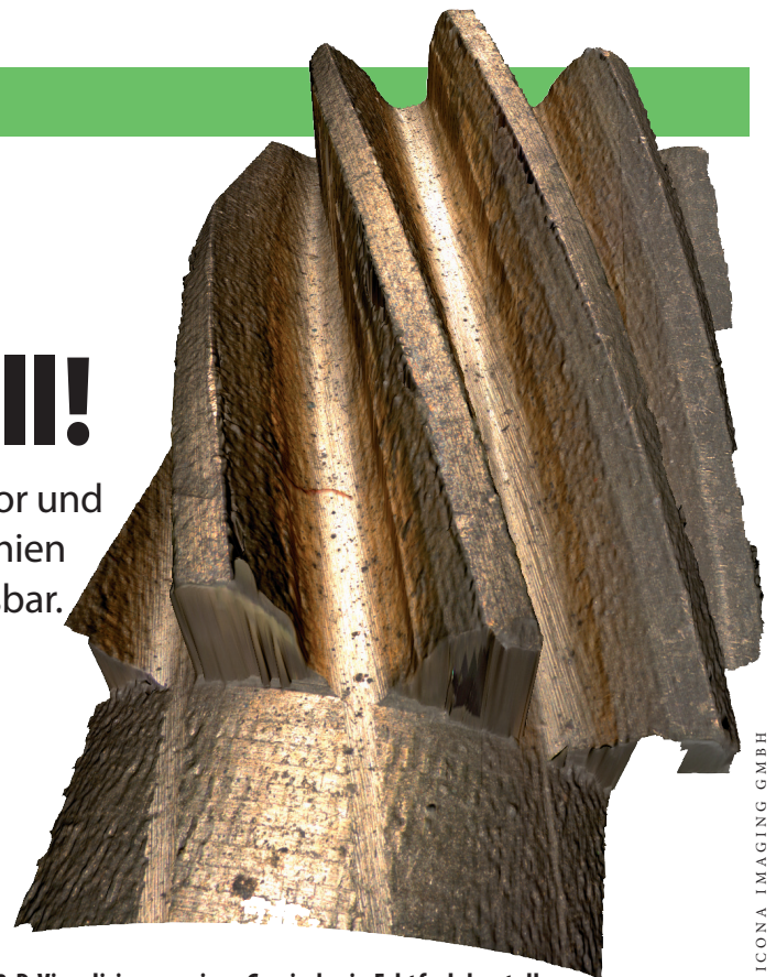
3-D-Visualisierung eines Gewindes in Echtfarbdarstellung

Optische Schweißpunktkontrolle. Hochfeste Schweißverbindung, kleine Nahtbreite und qualitativ hochwertige Schweißnähte ohne Versprödungserscheinungen sind die Vorteile einer Laserstrahlschweißung. Die Prüfung und Bewertung der Schweißpunkte oder ihre automatische Klassifika-