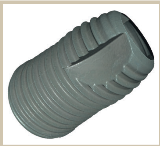
Bild 3. Mit der »Real 3D«-Technologie werden Implantate um 360° gemessen

keit und Rückführbarkeit. »Durch 3D-Messungen der Oberfläche, wie sie mit InfiniteFocus durchgeführt werden können, sind wir in der Lage, die Korrelation zwischen Topografie des Implantats und dessen Verhalten im Körper zunehmend fundierter und vor allem mit numerischen Werten zu bestimmen. Damit gelingt es auch, Rückschlüsse auf das biologische Verhalten zu ziehen. So können wir auch neue Materialien entsprechend optimieren«, erklärt der Experte in medizinischer Werkstoffkunde. Zu dieser Optimierung zählen auch die Untersuchungen zur Korrelation zwischen der Implantatopografie und dem Benetzungsverhalten. Ziel ist auch hier die Entwicklung von Implantaten, die gewährleisten, dass das Blut beim Implantieren die Oberfläche schnell benetzt. Studien belegen, dass die Topografie die Verteilung roter Blutkörperchen bereits nach wenigen Minuten günstig beeinflussen kann.